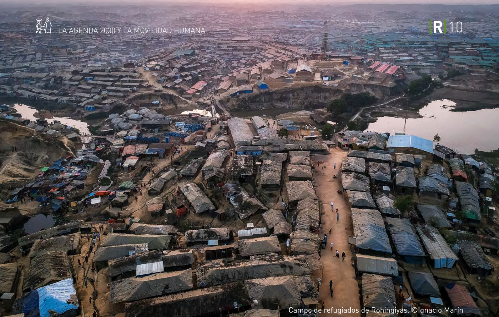
Campo de refugiados de Rohingya.

Son necesarios nuevos indicadores que superen las limitaciones de los que se han venido utilizando y que pueda reflejar el carácter multidimensional del desarrollo sostenible así como los resultados en cuanto a la coherencia de políticas.