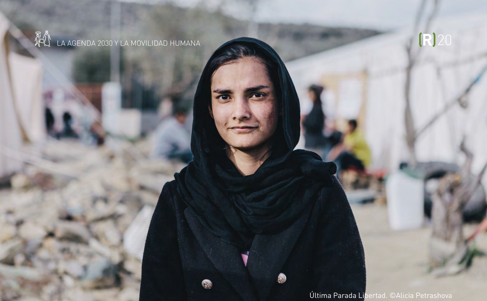
Última Parada Libertad.